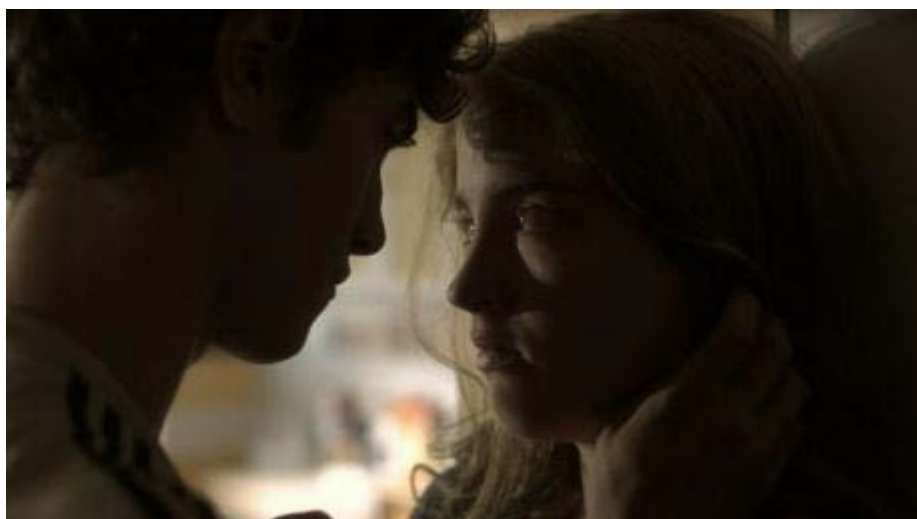
«Après le sud»

Premier film intense tiré d'un fait divers.